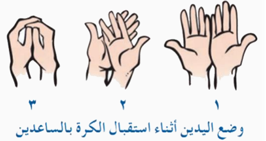
وضع اليدين أثناء استقبال الكرة بالساعدين