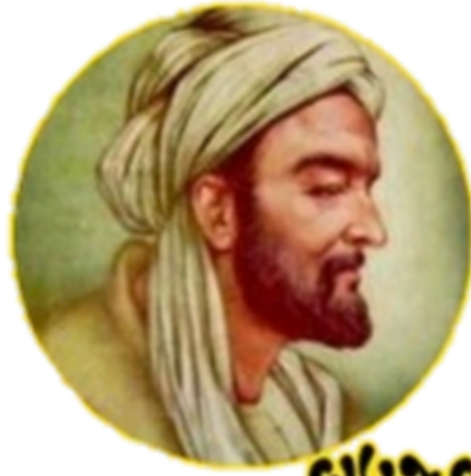
جابر بن حيان