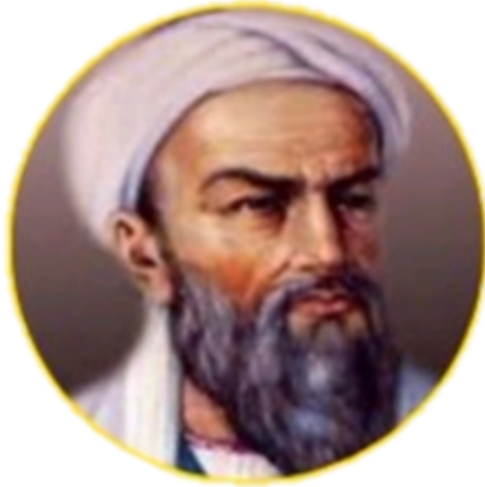
أبو بكر الرازي