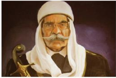
سلطان باشا الأطرش