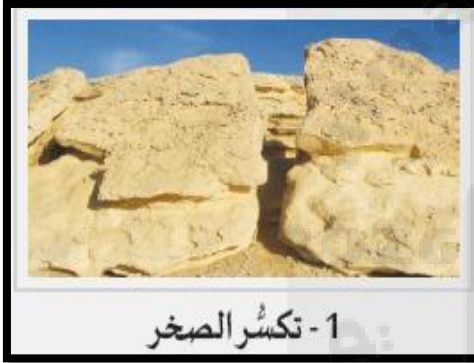
1- تكسر الصخر

التشابه : تفتت الصخور مع بقائها في مكانها