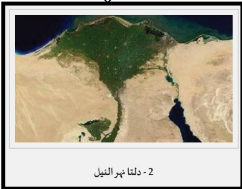
2 - دلتا نهر النيل

السؤال السابع : ما أسباب تكون الدلتاوات النهرية ؟