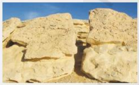
1- تكسر الصخر