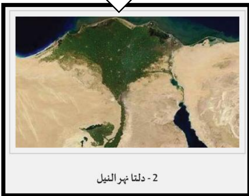
2 - دلتا نهر النيل

السؤال السابع : ما أسباب تكون الدلتاوات النهرية ؟