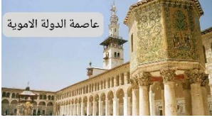
عاصمة الدولة الاموية

اختر الإجابة الصحيحة بوضع علامة * في المربع المقابل :-