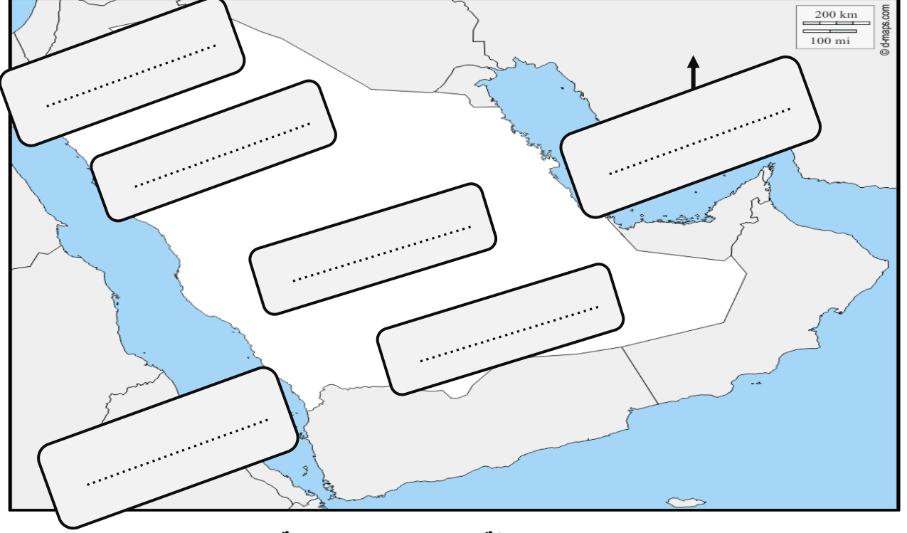
( خريطة شبه الجزيرة العربية )