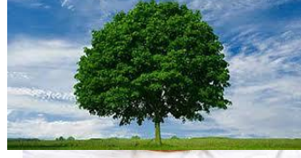
( ب )