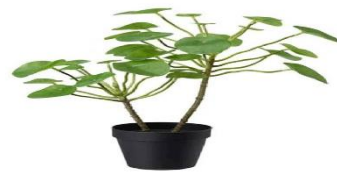
( أ )