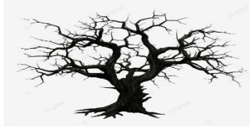
( ت )

أي من النباتات التالية لم تتوافر له الظروف المناسبة ليعيش؟