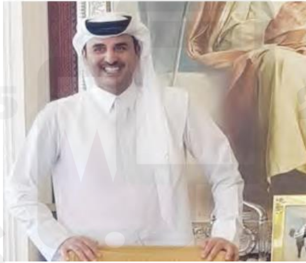
هذا أمير وطني قطر .