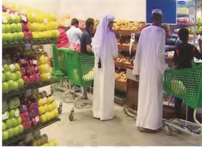
هذا سوق الخضار .