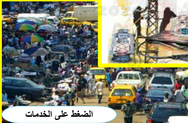
الضغط على الخدمات