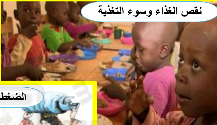
نقص الغذاء وسوء التغذية