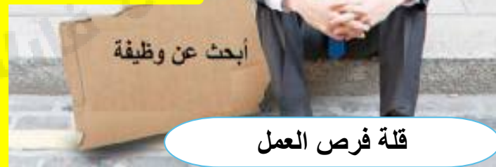
قلة فرص العمل