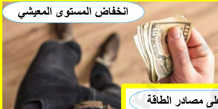
انخفاض المستوى المعيشي