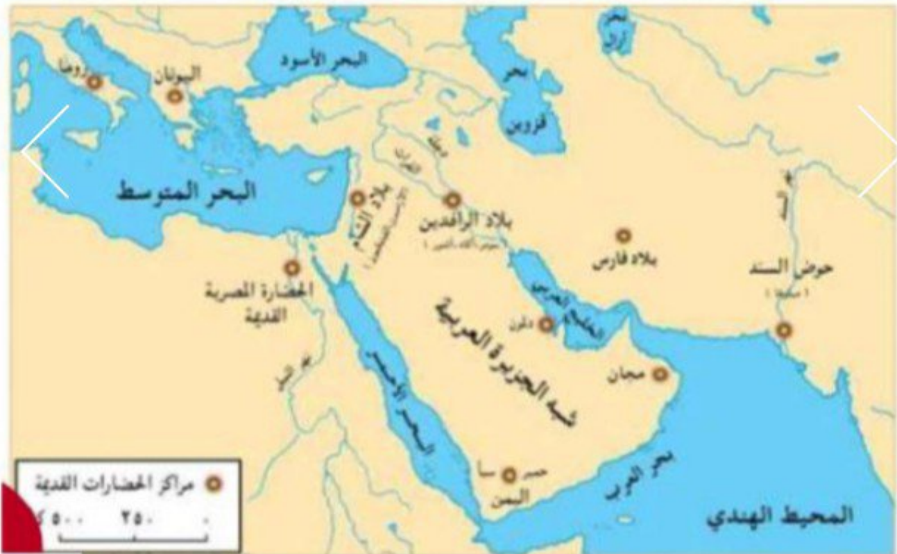
شكل (٦) خريطة مراكز الحضارات القديمة

* ما هي العوامل التي أدت إلى ظهور الحضارات في الوطن العربي؟