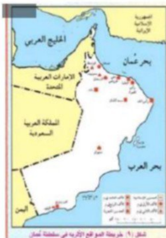
شكل (٩) خريطة المواقع الأثرية في سلطنة عُمان