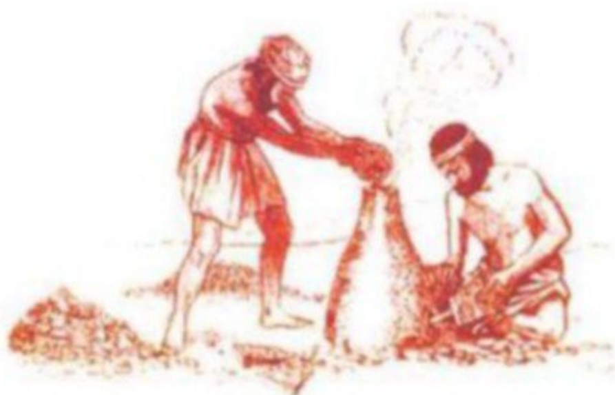
شكل (٨) صهر النحاس

وعثرت على بقايا فضلات عمليات الصهر في تلك المواقع ويلاحظ ان الوقود المستخدم لهذا الغرض هو فحم الخشب الذي كان يجلب من مناطق اخرى الى مواقع الصهر.