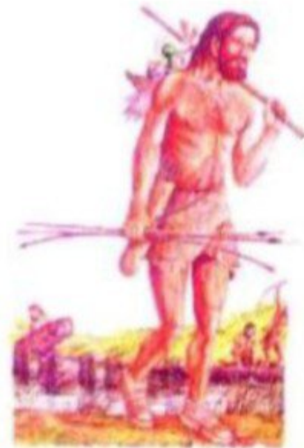
شكل (١) مرحلة الجمع والصيد