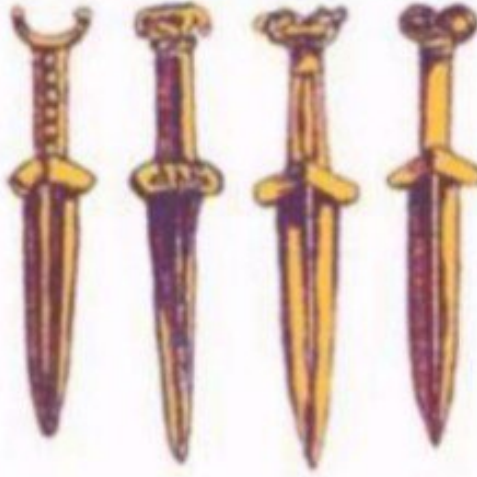
شكل (٥) أسلحة برونزية

اكتشف الإنسان معدن النحاس حوالي ٣٥٠٠ ق.م ، وتبين له أنه معدن سهل الانصهار والتشكيل ، ثم قام بمزجه بالقصدير فتوصل إلى إنتاج معدن البرونز ، وهو أكثر صلابة من النحاس .