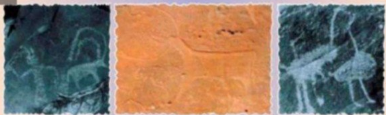
شكل (٧) الرسم على الصخور

- يعتبر توافر معدن النحاس على نطاق واسع في عمان القديمة عنصرا حضاريا مهما في تاريخها الحضاري فقد ظهرت صناعة الاسلحة والحلي وذلك بعد ان تمكن الانسان العماني في العصر الحجري الحديث من التوصل الى تقنية صهر النحاس فاصبح النحاس المادة الاساسية لصنع ادوات الانسان القديم.