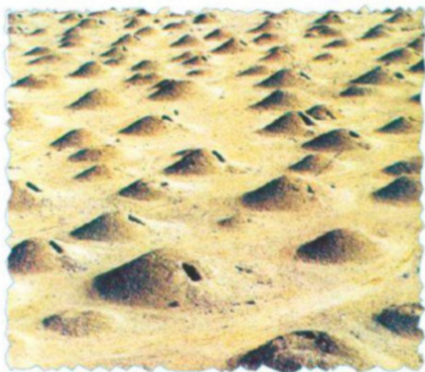
شكل (١٣) جانب من مقبرة عالي أكبر مقبرة تاريخية في العالم