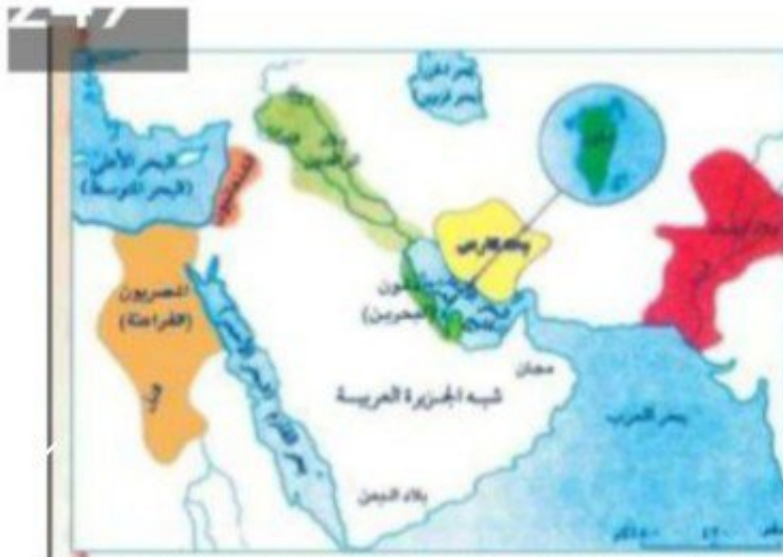
شكل (١٢) خريطة الحضارات القديمة في شبه الجزيرة العربية وما حولها

منذ خمسة آلاف سنة تقريبا كانت جزر البحرين مركزا لحضارة عظيمة تركت كثيرا من الآثار التي تدل على رقيها وقد عرفت قبل التاريخ بارض الفردوس وارض الخلود والحياة.