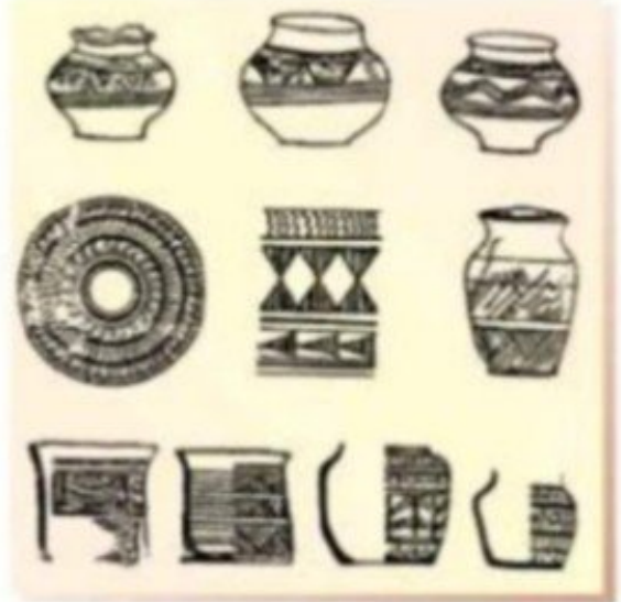
شكل (١٦) نماذج من فخار الخليج العربي