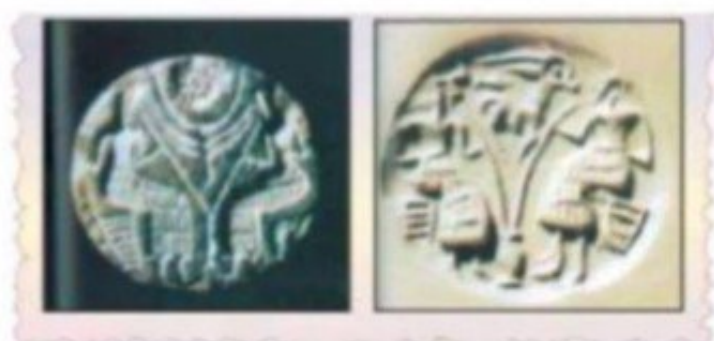
شكل (١٤) اختام دلمونية

2- العثور على كثير من الاواني الفخارية المتنوعة ولاسيما في القبور كما عثر على اواني نحاسية وتمائيل مختلفة وأنواع من العقود و الخواتيم واختام كانت تستخدم للمهمات الرسمية. - واكتشفت دلمون على مر التاريخ بانها الارض المباركة التي تنمو فيها النخيل وتكثر فيها الزبالة الذهبية واصبحت في نظر سكانها بمثابة الوطن الطاهر فجعلوها موطناً يحرم فيه القتل ولا يشكر فيه احد من شيء يضايقه.