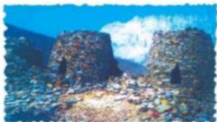
شكل (٩٠) مقابر من الألف الثالثة قبل الميلاد في بات

ومن خلال التنقيب والترميم الذي تقوم به وزارة التراث والثقافة عثر في جامع قلعة ولاية إهلا على (٢٧٠) قطعة فضية تعود إلى الألف الثالثة قبل الميلاد . وتؤكد هذه الآثار مع غيرها من المكتشفات الأثرية على أن الإنسان العماني يضرث بحلوه وعميقاً في الحضارة الإنسانية.