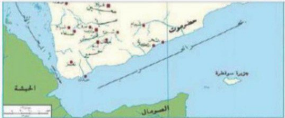
شكل (١٨) خريطة حضارة اليمن القديمة

- وقد قامت في اليمن في الفترة ما بين 1300 ق.م الى 575 م دول عدة منها: