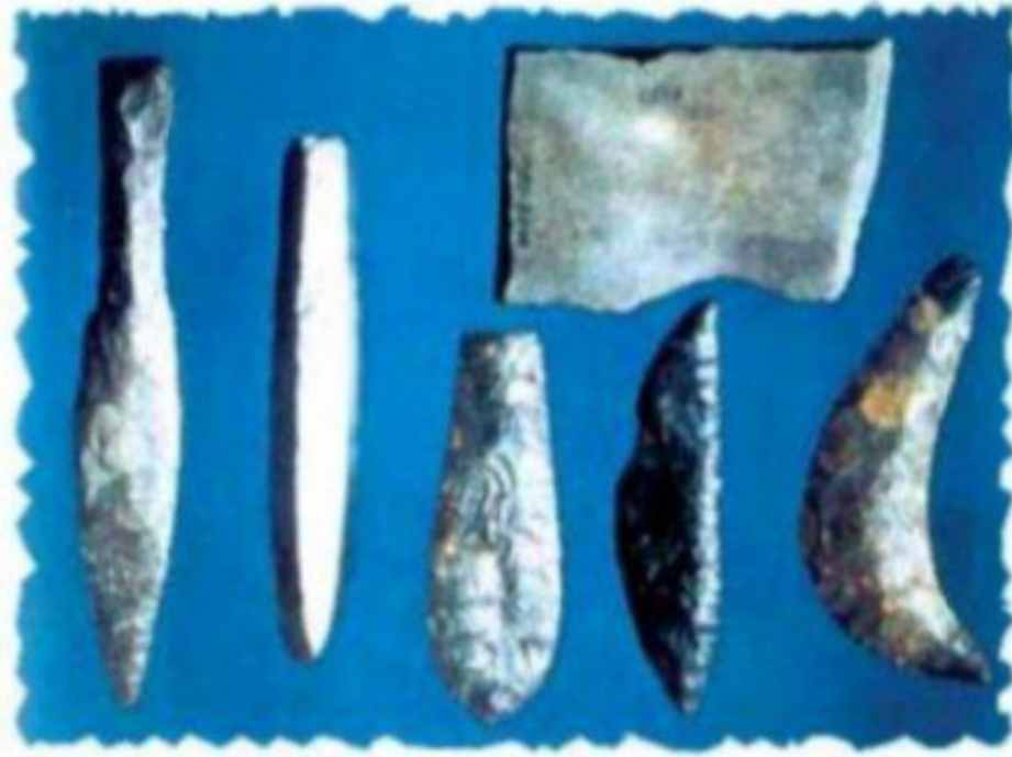
شكل (٣) من أدوات العصر الحجري