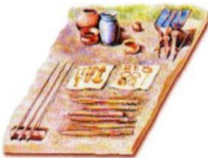
شكل (٢) من أدوات الإنسان القديم

فالحضارة: هي كل ما أوجده الإنسان من أجل سد احتياجاته سواء كان ذلك مادياً أم غير مادي وتنتج الحضارة من تفاعل الإنسان مع مكونات بيئته.