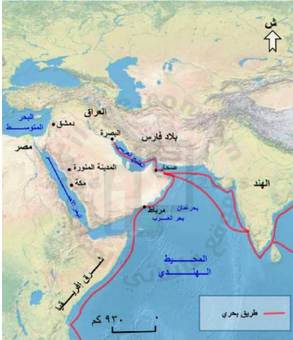
طرق التجارة البحرية العمانية قديمًا

يجب معرفة أسماء المناطق التي وصلت إليها عُمان ، ومعرفة موقعها على الخريطة