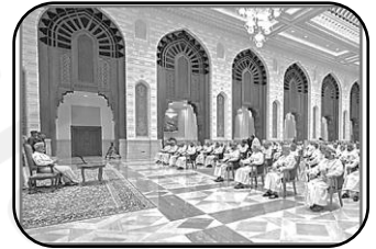
اللقاءات بين الحكومة والمواطنين