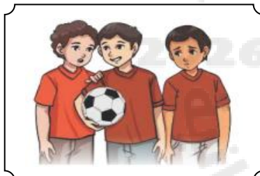
تناج منهي عنه