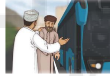
تقديم المساعدة للغير