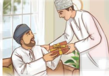
تقديم يد العون والهدايا للآخرين