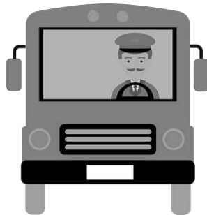
a bus driver