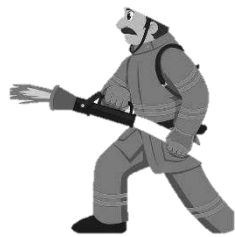
a fire fighter