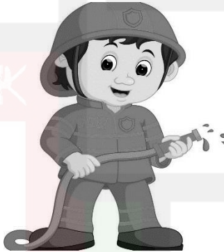
a fire fighter