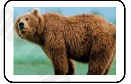
تمتلك الدببة حاسة شم جيدة جدا يمكن للدببة ان تشم رائحة الطعام من بعيد

السؤال الرابع : تأمل الشكل الذي امامك ثم اجب عن الأسئلة التي تليه .