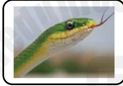
تشم الافاعي بواسطة السنتها

السؤال الثالث : تأمل الصور التالية ثم اكمل الفراغات