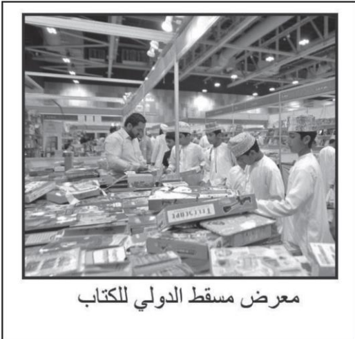
معرض مسقط الدولي للكتاب