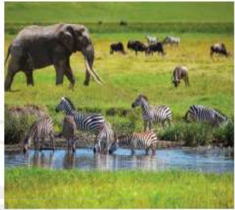
الصورة ١-٤ جزء من مجتمع أحيائي من الحياة البرية حول تجمع مائي في تنزانيا بأفريقيا.

* الجماعة الأحيائية : Population مجموعة من الكائنات الحية من النوع نفسه تعيش في النظام البيئي.