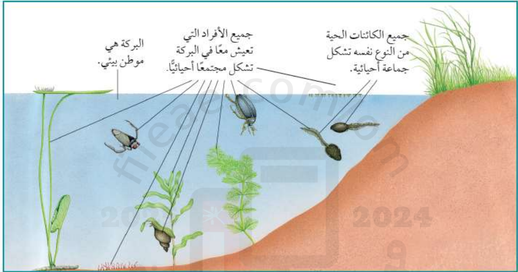
الشكل 1-4 البركة والكائنات الحية التي تعيش فيها تشكل نظامًا بيئيًا.