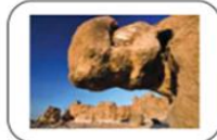
حديقة الصخور بالقم