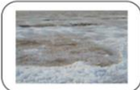
سيخة ام السميم