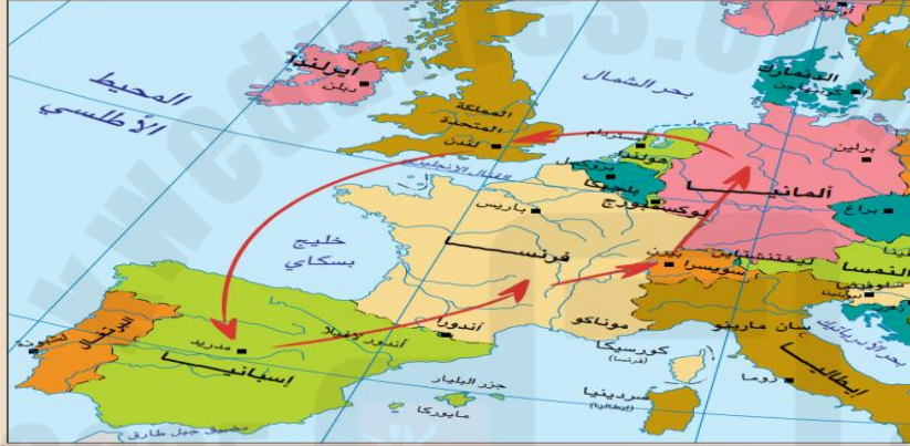
حل نشاط (٣) صفحة ١٠٤ :