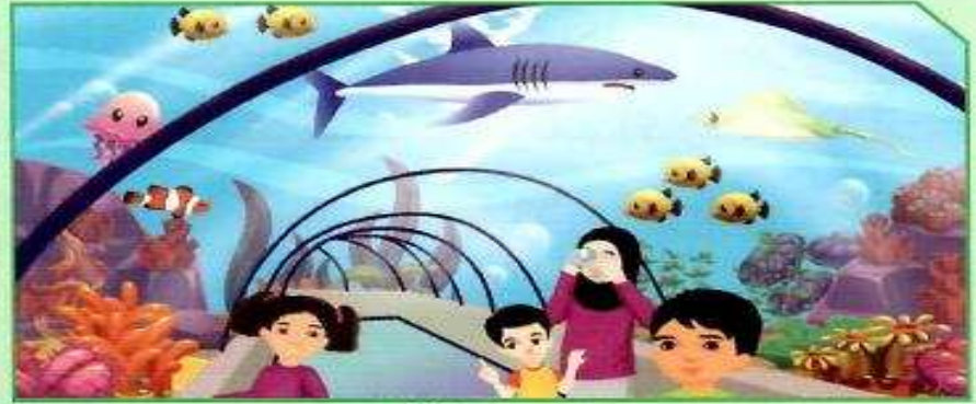
بيئة رقم (1)