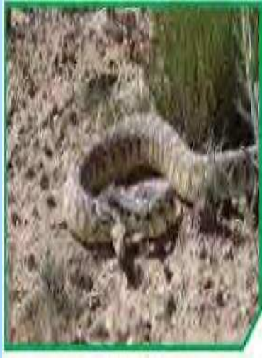
تجمع الثعابين في الصحراء

* المجموعة البيئية : هي تجمعات الكائنات الحية كلها التي تعيش في منطقة واحدة .