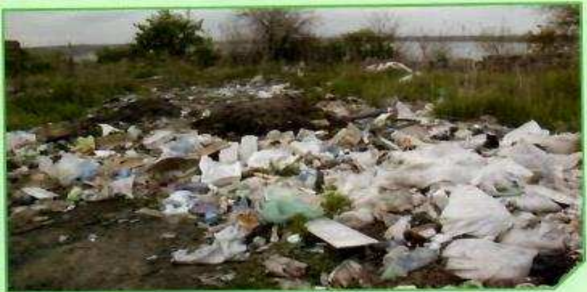
ج. تلوث التربة بالنفايات