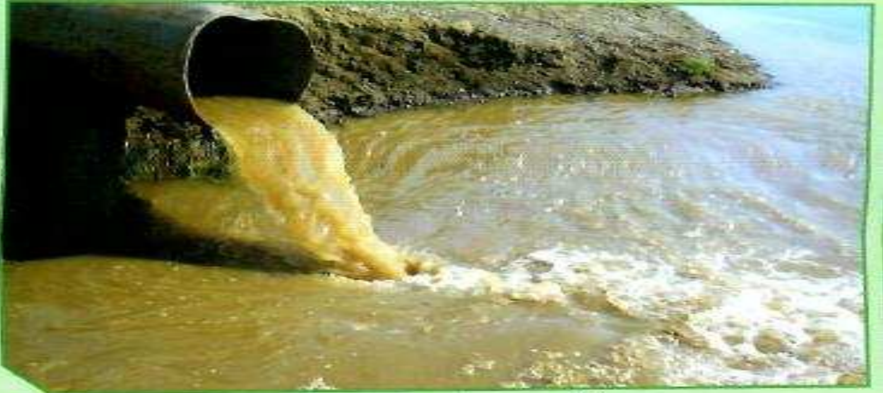
ب. تلوث مياه البحر بماء المجاري

(2) تلوث الماء يحدث عندما تتغير خصائص الماء مما يجعله غير صالح للاستخدام ، و يحدث ذلك بسبب تسرب النفط أو مياه المجاري أو المبيدات الحشرية .