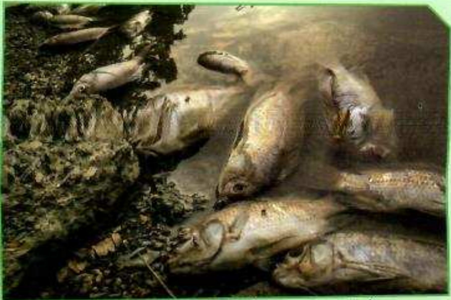
أ. ظاهرة نفوق الأسماك بسبب تلوث البحر