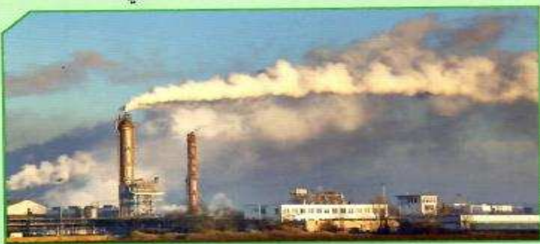
د. تلوث الهواء بالدخان

1) تلوث الهواء يحدث بسبب وجود مواد ضارة فيه كالدخان الذي يحتوي على غازات ضارة مثل ثاني أكسيد الكربون و ثاني أكسيد الكبريت .