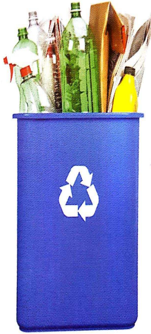
شكل (30): إعادة تدوير

هو إعادة استخدام بعض المواد التي لا تتحلل مثل البلاستيك و الزجاج و المعادن .