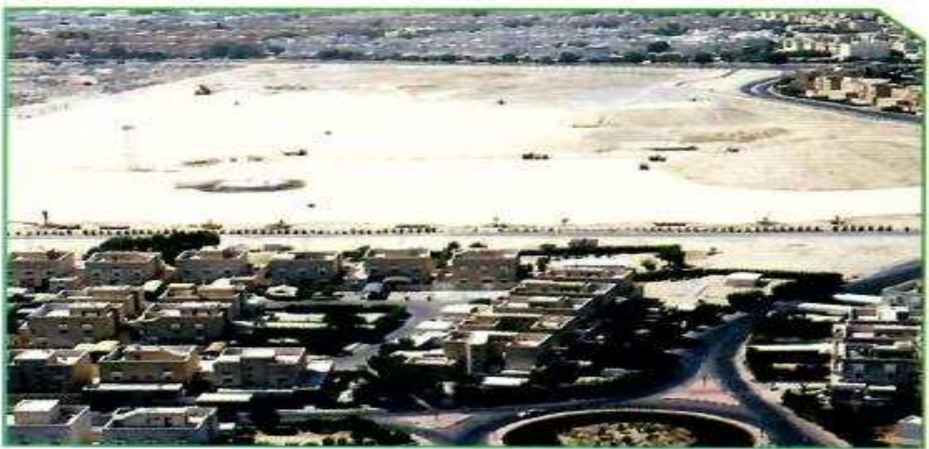
شكل (29) مردم نفايات القرين الذي يتوسط المنطقة السكنية