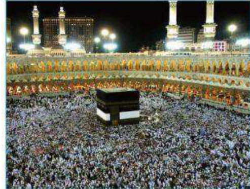
المسجد الحرام مكانه مكة المكرمة