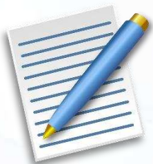
أوراق تقويمية وعمل