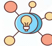
خرائط مفاهيم وخرائط ذهنية