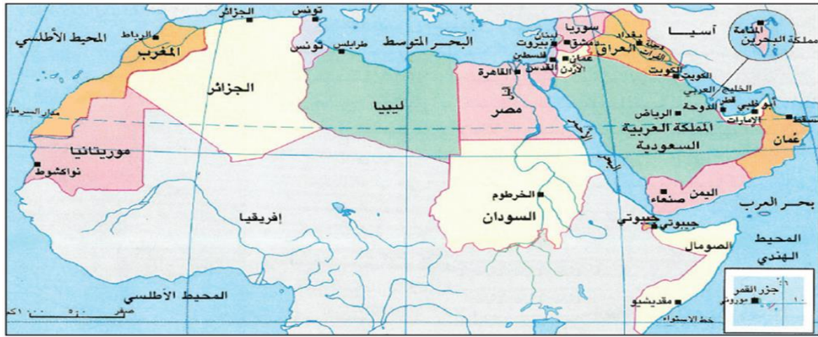
مستند ١ خريطة الوطن العربي السياسية