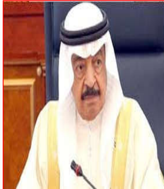
رئيس مجلس الوزراء