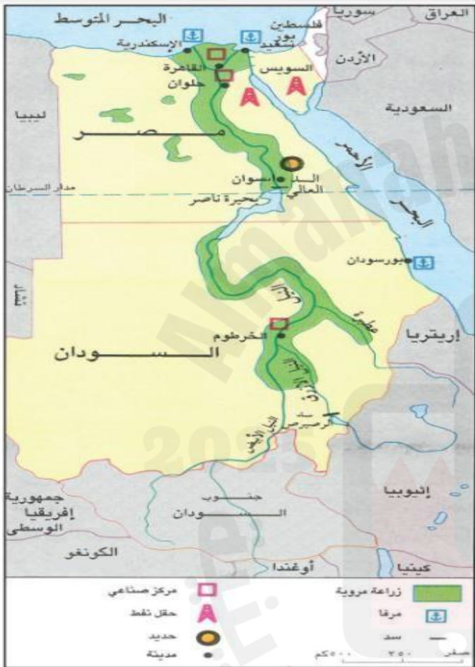
١ - خريطة وادي النيل