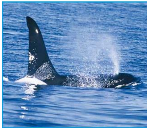
يخرج الحوت إلى سطح المياه ليحصل على الأكسجين لأنه لا يملك خياشيم