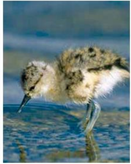
تشرب الحيوانات الماء بطرق مختلفة