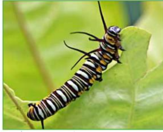
تتغذى يرقة الفراشة على أوراق الشجر