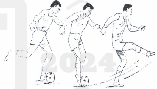
التصويب بوجه القدم الأمامي