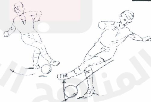
السيطرة على الكرة بوجه القدم الخارجي