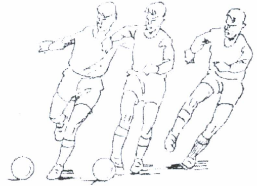
التمرير بوجه القدم الخارجي

اذكر اسم المهارة المناسبة أسفل الصور التالية: