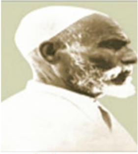
الزعيم عمر المختار