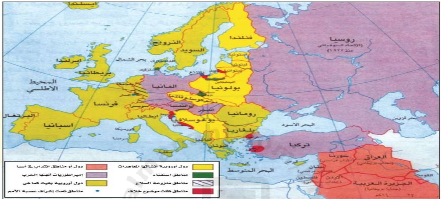
(٤) خريطة أوروبا بعد مؤتمر السلام ومعاهدات الصلح (١٩١٩ - ١٩٢٠ م)