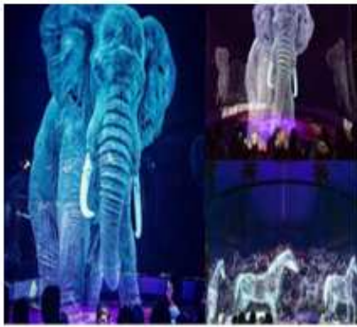
معرض حيوانيات السيرك الألماني يستخدم تقنية الهولوجرام بدلاً من الحيوانات الحقيقية

وَفِي أَلْمَانِيَا أُلْعِيَ (سِيرِك رُونكَالِي) عَامَ 2018م، عُرُوضَ الْحَيَوَانَاتِ التَّقْلِيدِيَّةِ، مُسْتَفِيدًا مِنْ تَقْنِيَةِ الهُولُوجَرَامِ لِتَقْدِيمِ عُرُوضٍ ثَلَاثِيَّةِ الْأَبْعَادِ لِحَيَوَانَاتٍ مُجَسِّمَةٍ عِمْلَاقَةٍ، تَمْنَحُ الْمُتَعَمِّقَةَ نَفْسَهَا الَّتِي يَعِيشُهَا الْجُمْهُورُ فِي الْعُرُوضِ التَّقْلِيدِيَّةِ، فَيُشَاهِدُونَ خَيُْولًا تَدُورُ حَوْلَ حَلَقَةِ السِيرِكِ، وَعِنْدَمَا تَخْتَفِي