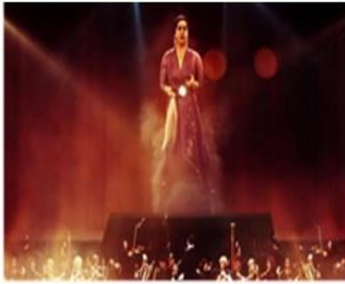
أوبرا أم كلثوم المسرح بعد أكثر من ٩٥ سنة من ولادتها

إِسْتُخْدِمَتْ مُؤَخَّرًا تَقْنِيَةُ الهُولُوجَرَامِ فِي ظُهُورِ فَنَّانِينَ رَاجِلِينَ مُنْذُ زَمَنِ بَعِيدٍ، عَلَى خَشَبَةِ الْمَسْرَحِ أَمَامَ جَمَاهِيرِهِمْ مَرَّةً أُخْرَى، وَكَأَنَّهُمْ أَحْيَاءُ يَتَحَرَّكُونَ وَيُؤَدُّونَ فَتَنَّهُمْ، كَانَ آخِرُهَا هَذَا الْعَامَ عِنْدَمَا ظَهَرَتْ الْفَنَّانَةُ الرَّاحِلَةُ أُمُّ كُلْثُومَ عَلَى مَسْرَحِ "دَبِي أوبرا" فِي أَكْثَرِ مَنْ حَفْلٍ فَنِّيٍّ.