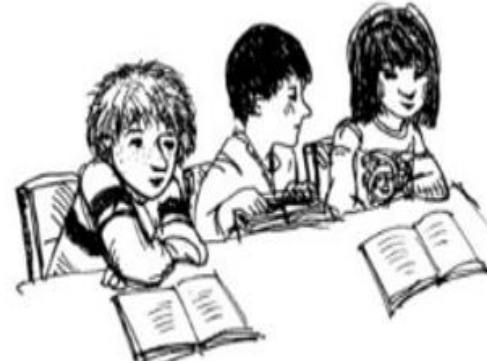
أصدقاء دراسة جدد