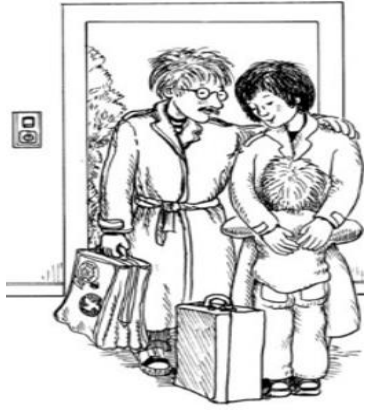
سفر الوالدين لأسبوع