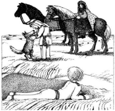
تدخل الحلم بالواقع