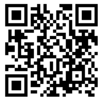
التعبير المجازي والحقيقي