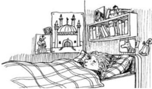
إكمال القصة بالحلم