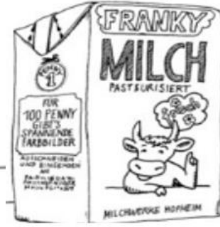
يحب القراءة + جمع الصور + الفواكه المحفوظة