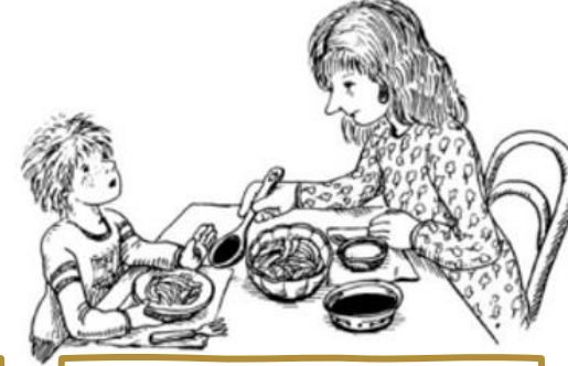
حزم السيدة يعقوب