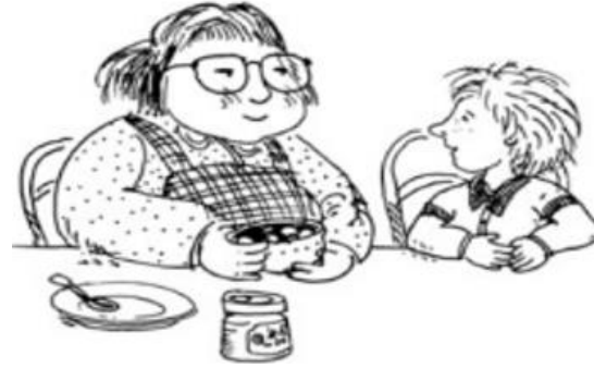
عطف السيدة يشكى