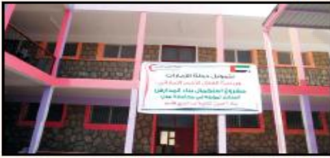
صورة 2 المساعدات التي قدمتها الإمارات لليمن