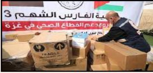
صورة 1 المساعدات الصحية التي قدمتها الإمارات لغزة