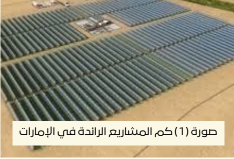
صورة (1) كم المشاريع الرائدة في الإمارات