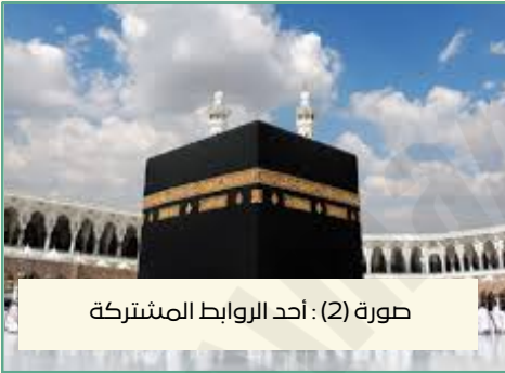
صورة (2) : أحد الروابط المشتركة

تجمع دول مجلس التعاون الخليجي روابط قوية ومتينة تجعلها كياناً متماسكاً يسير نحو مستقبل مشترك وفي مقدمة هذه الروابط تأتي اللغة العربية التي ليست مجرد وسيلة تواصل بل هي وعاء الثقافة والتاريخ والموروث الأدبي المشترك الذي يوحد شعوب الخليج كما أن الدين الإسلامي يشكل أساس القيم والمبادئ التي تحكم المجتمعات الخليجية حيث توحدهم العقيدة وتجمعهم العبادات والمناسبات الدينية ولا يمكن الإغفال عن دور العادات والتقاليد المتشابهة التي تعكس أصالة الشعوب الخليجية من الضيافة العربية الأصيلة إلى اللباس التقليدي والمهرجانات التراثية وهذه التقاليد تعزز الشعور بالانتماء المشترك رغم اختلاف الدول إلى جانب ذلك فإن المصالح والمصير المشترك يربطان هذه الدول سواء من حيث التعاون الاقتصادي أو مواجهة التحديات السياسية والأمنية بروح الوحدة والتضامن أما وحدة الأرض فهي رابطة جغرافية تجعل التواصل والتكامل بين دول الخليج أمراً طبيعياً وسلساً حيث تمتد أراضيها ضمن بيئة متجانسة تسهل حركة التجارة والنقل والسكان وهذه الروابط ليست مجرد شعارات بل هي الأساس الذي يجعل مجلس التعاون الخليجي نموذجاً للوحدة والقوة في عالم متغير