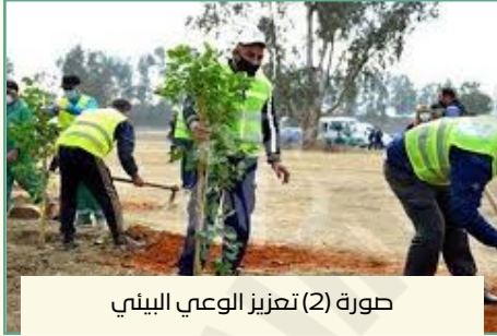
صورة (2) تعزيز الوعي البيئي