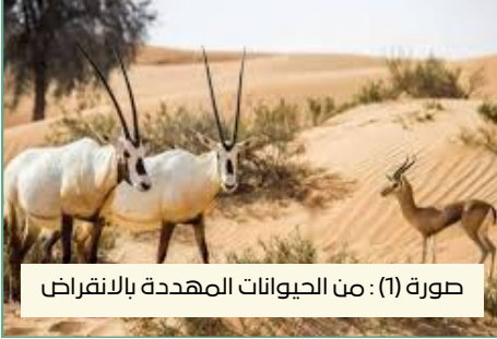
صورة (1) : من الحيوانات المهددة بالانقراض