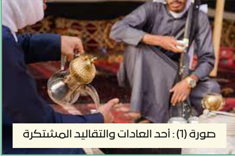
صورة (1) : أحد العادات والتقاليد المشتركة