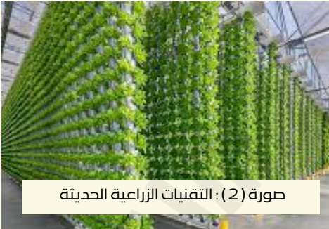
صورة (2) : التقنيات الزراعية الحديثة