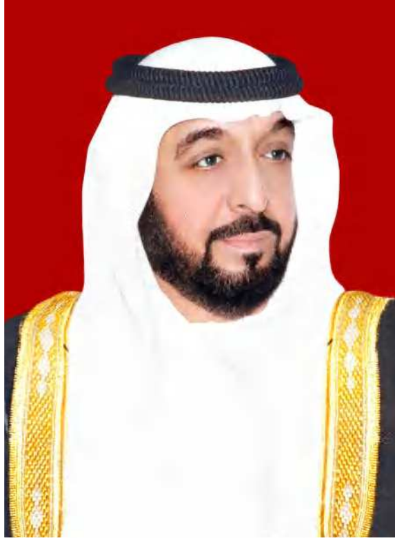
صاحب السمو الشيخ خليفة بن زايد آل نهيان رئيس دولة الإمارات العربية المتحدة، حفظه الله

"يجب التزوّد بالعلوم الحديثة والمعارف الواسعة والإقبال عليها بروح عالية ورغبة صادقة، حتى تتمكّن دولة الإمارات خلال الألفيّة الثالثة من تحقيق نقلة حضاريّة واسعة."