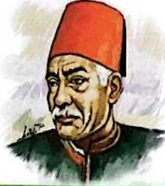
الشاعر حافظ إبراهيم