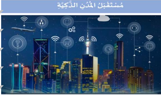
مستقبل المدن الذكية

- اقرأ النص الآتي بعنوان ( مستقبل المدن الذكية ) للدكتورة (عائشة بن نوي)، ثم أجب عن الأسئلة التي تليها: