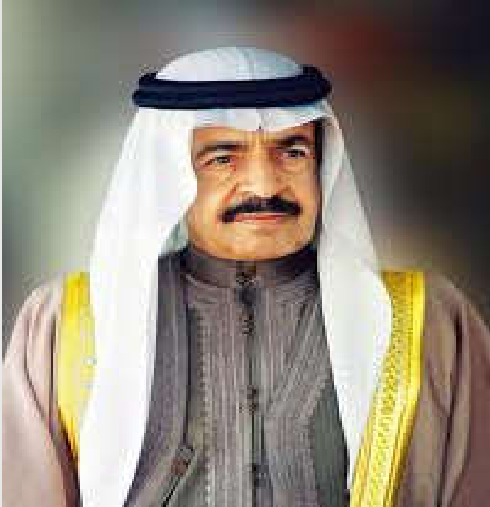
سمو الأمير خليفة بن سلمان آل خليفة حفظه الله ورعاه