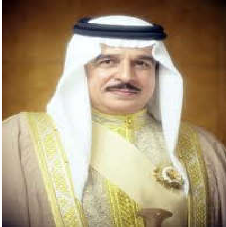
جلالة الملك حمد بن عيسى آل خليفة حفظه الله ورعاه