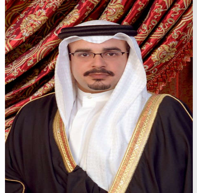
سمو الأمير سلمان بن حمد آل خليفة حفظه الله ورعاه